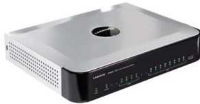
Para 8 puertos