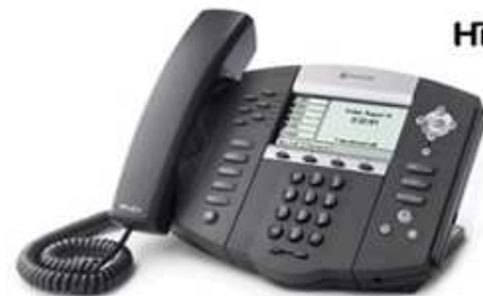
Polycom 650 + botonera