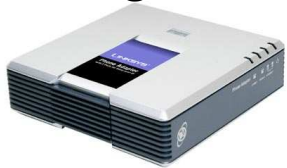
Para 2 puertos